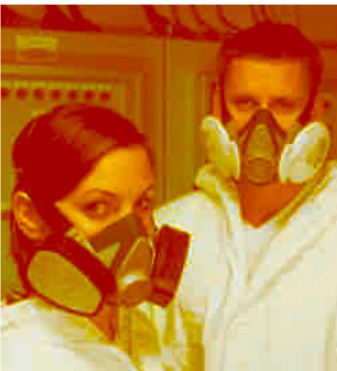
Le demi-masque Advantage 200 LS

MSA a encore amélioré son demi-masque Advantage 200. Le résultat est un masque hautes performances, économique et facile à utiliser.