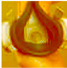
La zone de contact AnthroCurve