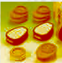
Filtres Poussières, Gaz ou Combinés pour le demi-masque Advantage 200 LS