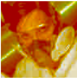
Advantage 200 LS avec FLEXfilter